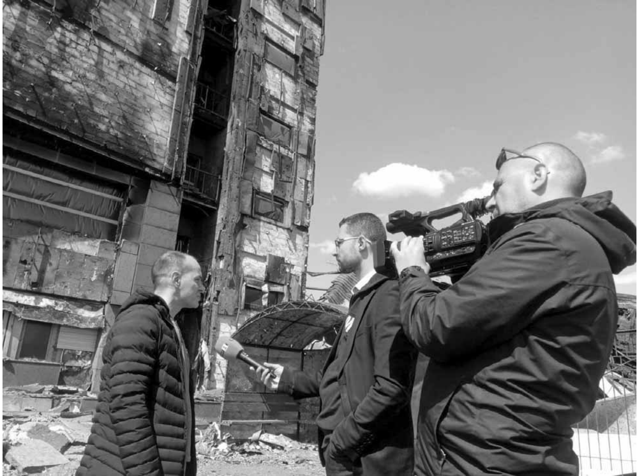
Предградие на Киев на име „Чайки“, на няколко километра югоизточно от пътя за Ирпин-Буча и Хостомел. Сградата е една от разрушените в първите часове, в които руски сили поемат към Киев от северозападна посока. Снимката е заснета на 10.05.2022 г.